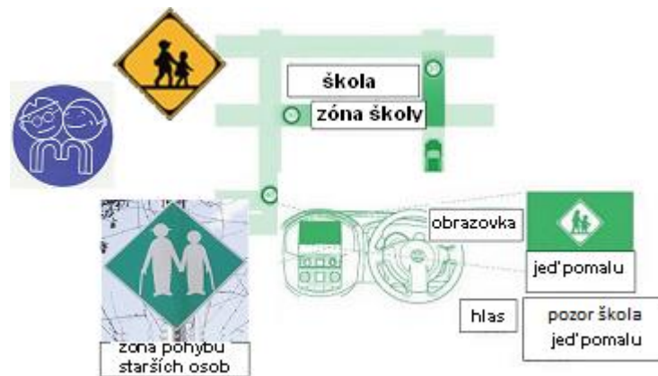
Obrázek 3 — Informace o dopravní zóně (D.1.7 s nabídkou silničních informací)

Systém může nabízet řidiči informace o momentálním využití místní pozemní komunikace, například o rozdělení pozemní komunikace na část využívanou chodci a část využívanou vozidly, za účelem zvýšení bezpečnosti žáků a dětí při cestě do školy.