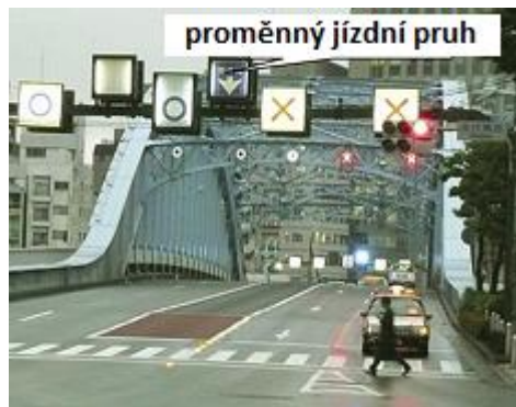
Obrázek 2 — Informace o jízdních pruzích (D.1.3 s přehledem informačních služeb k jízdnímu pruhu)