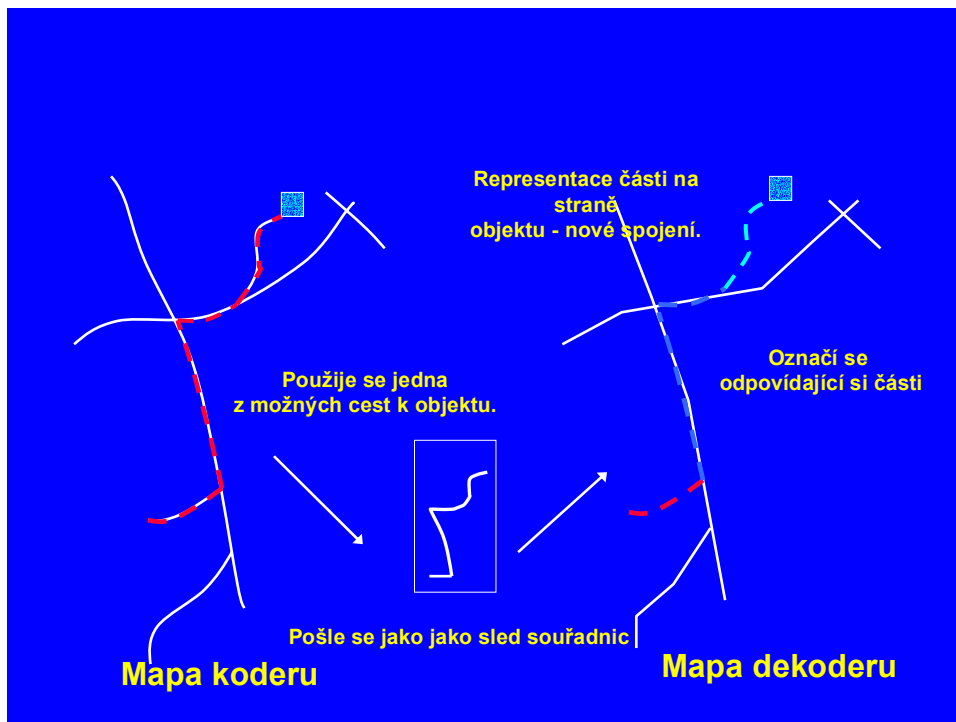
Obr. 2. Schéma principu lokalizační metody „On-the-fly“

Projekt Agora započal v říjnu roku 2000 jako dvouletý projekt vědy a výzkumu pod záštitou organizace ERTICO. Na realizaci se podíleli přední společnosti v oblasti mapových podkladů a navigačních systémů Navteq, TeleAtlas, Bosch Blaupunkt, VDO a.j. V rámci projektu byly integrovány tři základní metody: