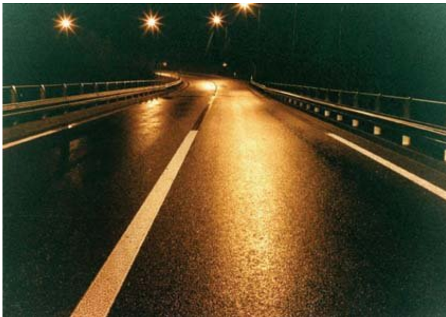
Obrázek 3 – Viditelnost strukturálního značení v podmínkách za mokra v noci

Podobné zkušenosti se strukturálním značením byly zaznamenány ve Velké Británii, kde došlo k výraznému snížení nehodovosti v podmínkách za mokra v noci.